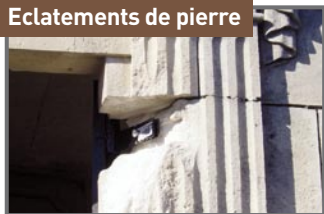
Eclatements de pierre

Pertes locales dues à des pressions internes, liées à l'augmentation de volume d'éléments métalliques comme les agrafes.