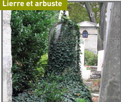
Lierre et arbuste

Couper à la base des racines et renouveler jusqu'à la mort des végétaux. Ne pas arracher .